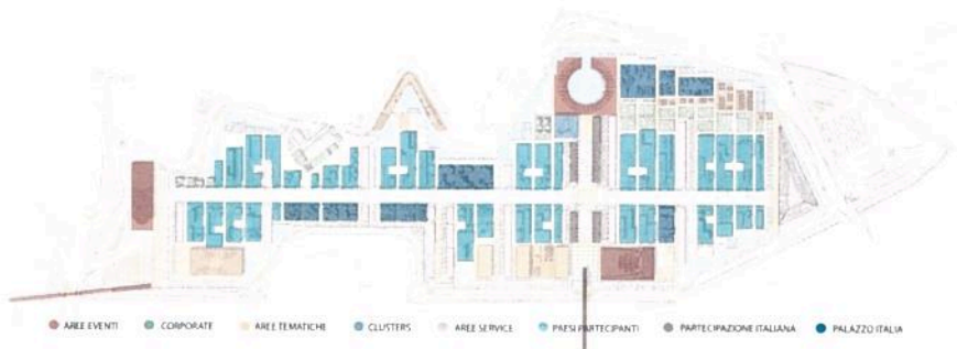
Figura 1. Masterplan di Expo 2015

Il Sito espositivo è situato a Nord-Ovest di Milano, in prossimità del Polo Fieristico di Rho-Pero (Fiera Milano) e si estenderà approssimativamente su una superficie di circa 1 milione di metri quadrati. L'area espositiva è stata progettata come un unico paesaggio – un'isola circondata da un canale d'acqua – strutturata intorno a due assi perpendicolari di forte valore simbolico: il Decumano e il Cardo, elementi ordinatori delle antiche città romane. Il Sito, concepito come un'area espositiva all'aperto, è caratterizzato dall'abbondanza di zone verdi che occuperanno una superficie di oltre 280.000 metri quadrati. Ciascun Paese Partecipante sarà invitato ad esprimere la propria personale interpretazione del tema sui lotti allineati lungo i principali assi del Sito, il Decumano o World Avenue.